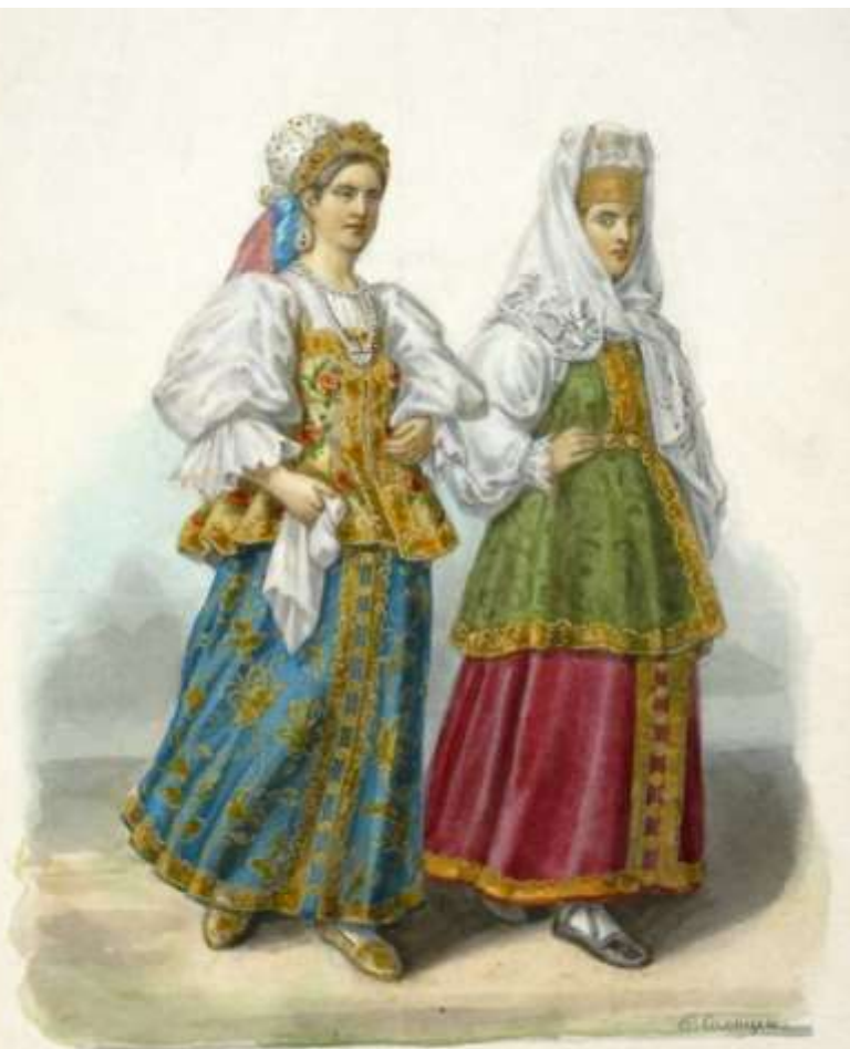
женщины города Осташко́ва в праздничном наряде.

императрица Екатерина решает: всему населению России - кроме дворян! - носить "старо-боярскую одежду", в том числе и сарафан, но шить одежду из российских тканей. Вот так сарафан "пришёл в народ" и стал любимым женским нарядом.