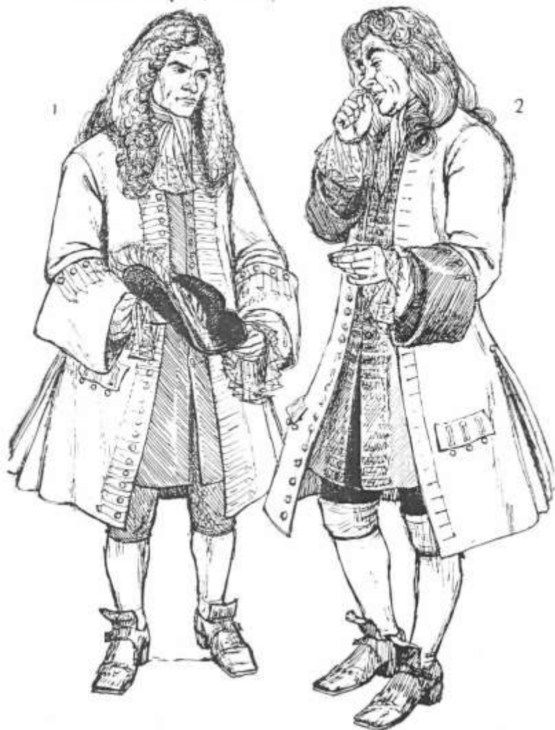
William III (1689 - 1702)

Пётр1 велел указом всем одеваться по европейской моде.